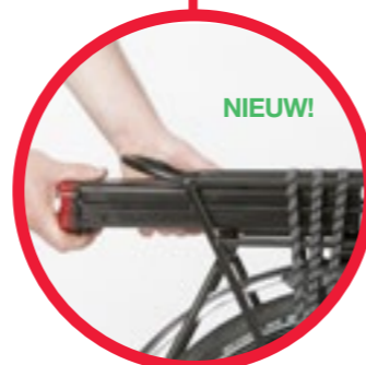
418 Wh accu met 29% grotere capaciteit (meerprijs €119,-)