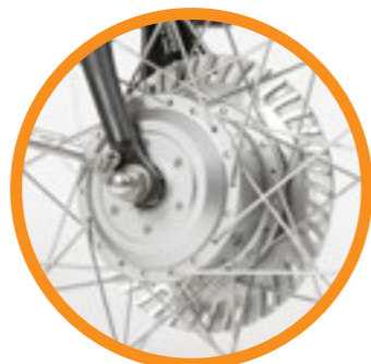
Extra remkracht met Shimano IM81 rollerbrakes

Bergachtig terrein: volle ondersteuning 15-25 km. Gemiddeld terrein: gemiddelde ondersteuning 25-35 km. Vlak terrein: lage ondersteuning 35-50 km LET OP: dit is slechts een indicatie!