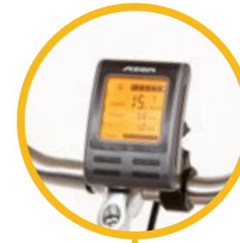
LCD display (meerprijs €125,-)

Dit is de standaard display, geen poespas, wat er niet opzigt kan ook niet stukgaan!