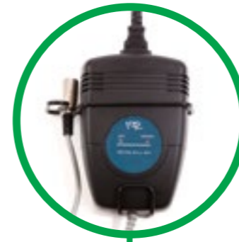
Acculader-muurhouder apart verkrijgbaar prijs €10,-

Bakfiets.nl gebruikt uitneembare accu's. Hierdoor kunt u altijd overal de accu makkelijk opladen