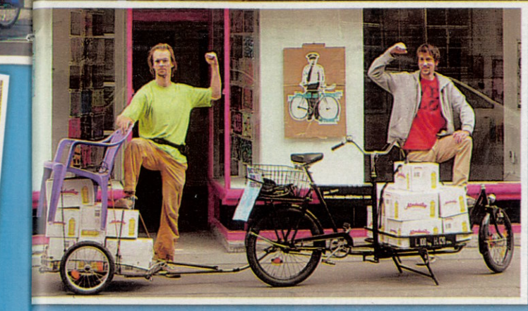
Drei junge Wiener Radfreunde fanden in ihrem Hobby eine Geschäftsidee